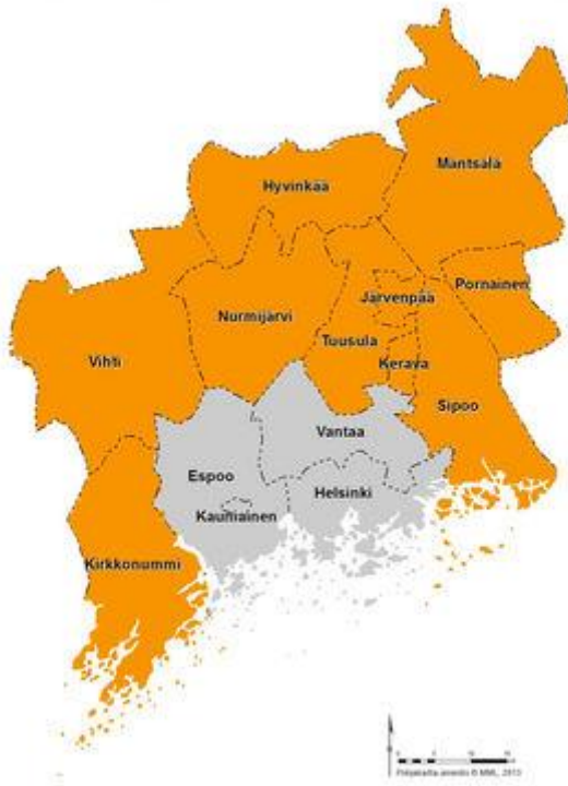
Kuvio 3. KUUMA -seutu

KUUMA -seutu muodostuu pääkaupunkiseudun ympärillä sijaitsevasta 10 kehyskunnasta. KUUMA -kuntiin kuuluvat Hyvinkää, Järvenpää, Kerava, Kirkkonummi, Mäntsälä, Nurmijärvi, Pornainen, Sipoo, Tuusula ja Vihti.