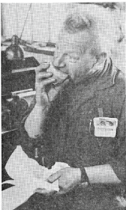
Välillä on ollut kysymyksiä siitä, miten näitä papereita valmistetaan. Koko maan paperiteollisuuden lakko oli jo oven takana.